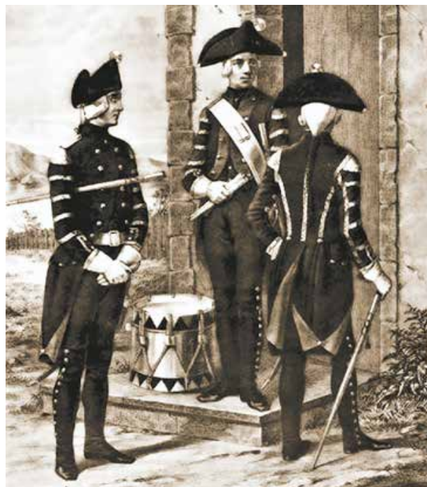
ПОЛКОВЫЕ БАРАБАНЩИКИ АСТРАХАНСКОГО, КИЗЛЯРСКОГО, ЦАРИЦЫНСКОГО ГАРНИЗОНОВ. 1797-1800 гг.