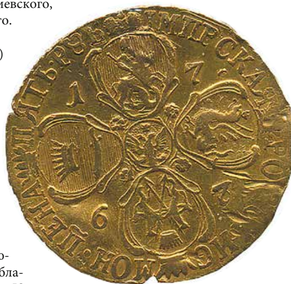
МОНЕТА ЕКАТЕРИНИНСКАГО ДВОРА. XVIII в.